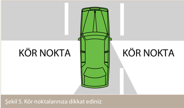
Şekil 5. Kör noktalarınıza dikkat ediniz

Olası tehlikeler her yerde olabilir, dolayısıyla sadece önünüze bakmanız ve aynalarınızı kullanmanız yeterli değildir. Arkayı görme aynalarınızı ne kadar iyi ayarlasanız da arabanızın etrafında göremediğiniz kör noktalar vardır. Bu bölgeler sürücünün arkasında kalan ve sadece aynalarla görülemeyen bölgelerdir, örneğin sürücü tarafındaki arka kapının dış tarafı gibi.